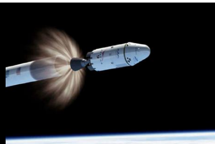
Launcher Upper Stage ロケット上段用推進系