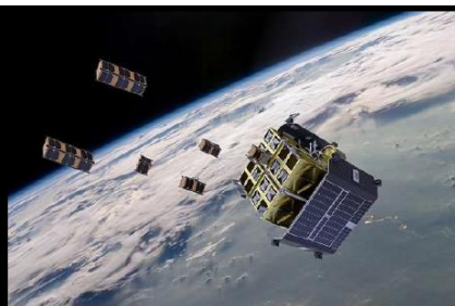
Orbital Transfer Vehicle (OTV)